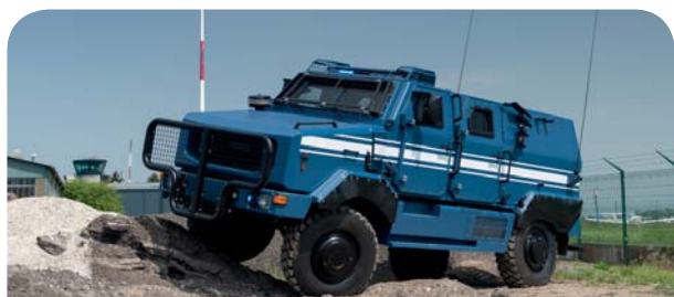
MPGV, Multi Purpose Gendarmerie Vehicle

pour vous y accueillir et vous tenir informé sur ses dernières solutions de défense et de sécurité.